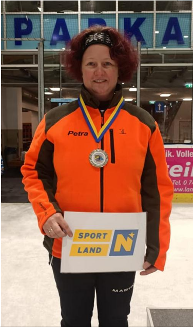
Vizelandesmeister und Vizestaatsmeister Ziel Damen